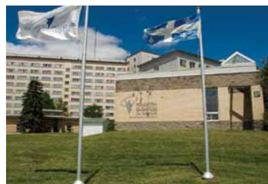
ESTRIE 880 résidants 4 833 nuitées