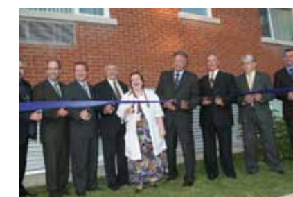
2005 Ouverture des Hôtelleries de Trois-Rivières et de Gatineau Agrandissement de l'Hôtellerie de Sherbrooke

À l'époque, les personnes atteintes de cancer des régions du nord du Québec n'avaient toujours pas accès à un service d'hébergement à proximité de leur lieu de traitement situé à Gatineau. La Fondation a d'abord aménagé pour elles un simple appartement avec huit lits afin de répondre à leurs besoins.