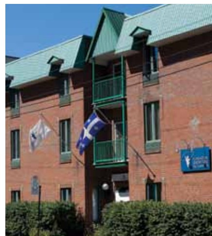
MONTRÉAL 1 152 résidants 8 114 nuitées

Depuis 1988, les Hôtelleries de la Fondation ont hébergé plus de 32 000 Québécois et Québécoises. Après deux décennies d'accueil et d'entraide, ces lieux de passage sont devenus bien plus qu'un toit pour les personnes atteintes de cancer. Aujourd'hui, chacune des Hôtelleries offre à ses résidants un véritable milieu de vie, qui devient le théâtre de grandes victoires sur la maladie.