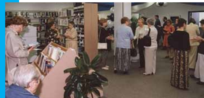
1989 Ouverture du Centre de documentation à Québec

À l'époque, il existait peu d'information vulgarisée et en français pour les Québécois atteints de cancer. La toute première action de la Fondation fut donc la production d'une brochure sur la radiothérapie, qui fut distribuée dans tous les centres de radio-oncologie au Québec.