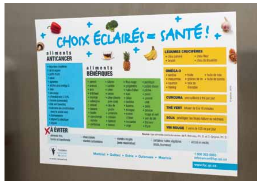
OUTIL DE PRÉVENTION Choix éclairés = santé!