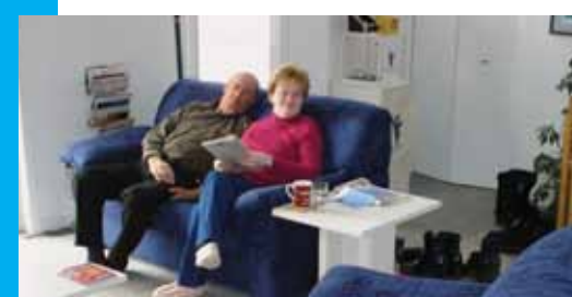
1996 Mise sur pied d'un projet-pilote d'hébergement en Outaouais

Grâce à l'exceptionnelle générosité des Chevaliers de Colomb du Québec, qui ont alors recueilli 2,5 millions de dollars, la Fondation a pu ouvrir ses deux premières Hôtelleries. Le besoin était bien réel : des Québécois atteints de cancer devaient parfois abandonner leurs traitements pour des raisons financières.