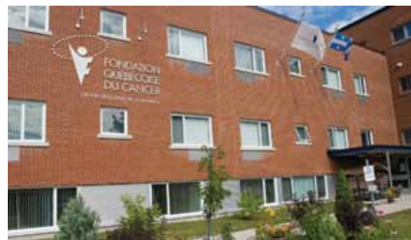
MAURICIE 383 résidants 2 672 nuitées