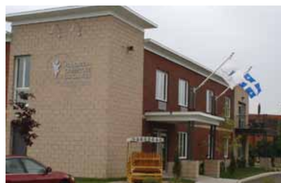
OUTAOUAIS 628 résidants 4 340 nuitées