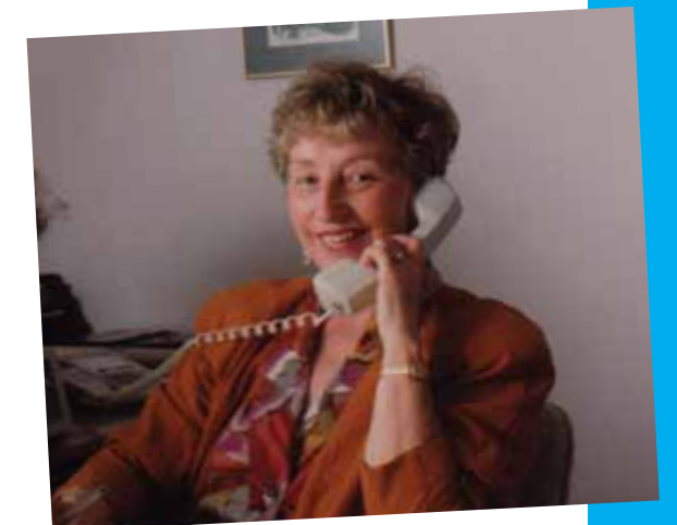
1984 Création de la Ligne Info-cancer

Alors qu'il n'offrait qu'une dizaine d'ouvrages à ses débuts, le Centre de documentation propose aujourd'hui une collection de quelque 5 000 titres, ce qui en fait la principale bibliothèque francophone spécialisée en oncologie en Amérique du Nord. En plus de 20 ans, les besoins en information des Québécois ont bien changé. Si en 1989, les aspects médicaux liés au cancer étaient à démystifier, de nos jours, ce sont les aspects psychosociaux et les thérapies complémentaires aux traitements médicaux qui suscitent le plus d'intérêt.