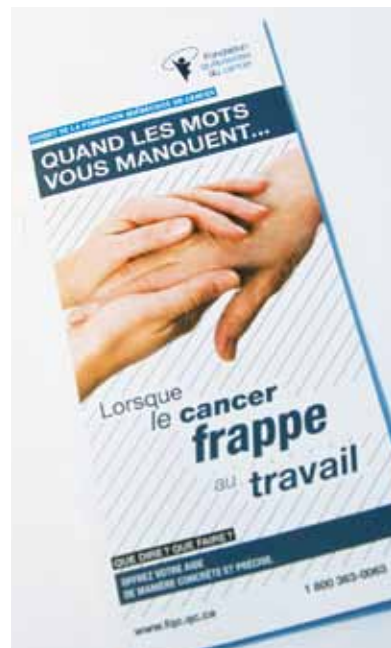
BROCHURE Quand les mots vous manquent